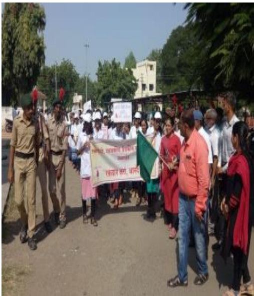
Donate Dated on 1/10/2018