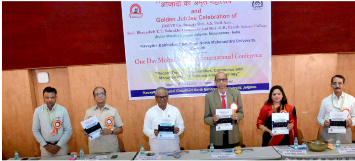
Hon. Delegates releasing the Four Volumes of the Research Journals. (April 9, 2022)