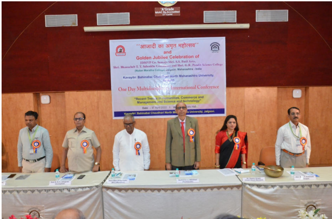
A moment of National Anthem (April 9, 2022)