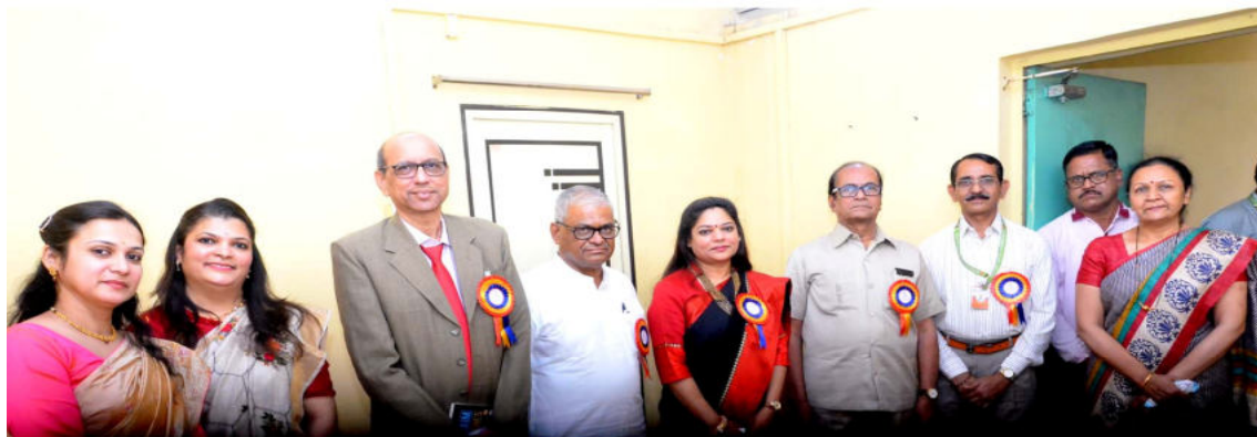
Hon. Vice Chancellor with all the delegates (April 9, 2022)