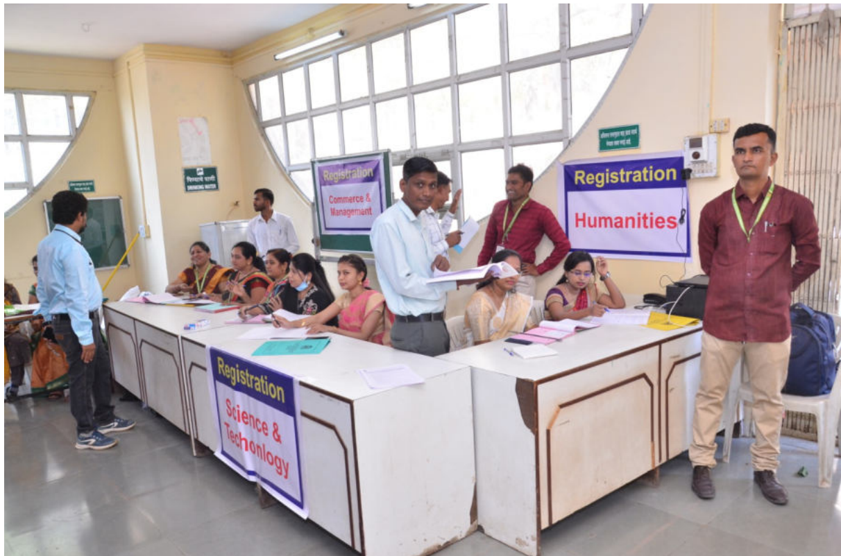
Registration (April 9, 2022)