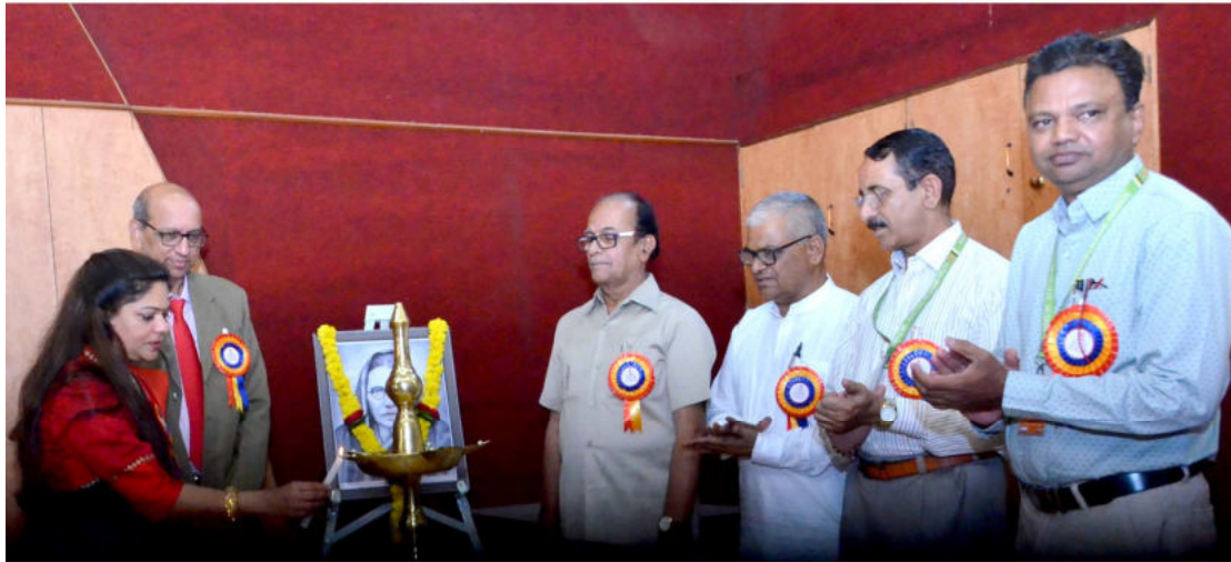
The Inauguration of the One Day Multidisciplinary Conference (April 9, 2022)