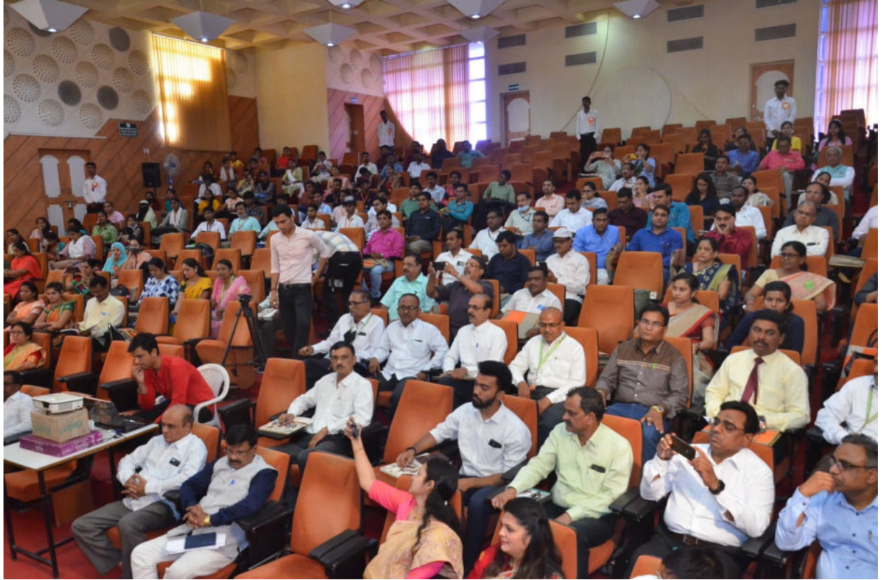
The delegates and participants present for conference. (April 9, 2022)