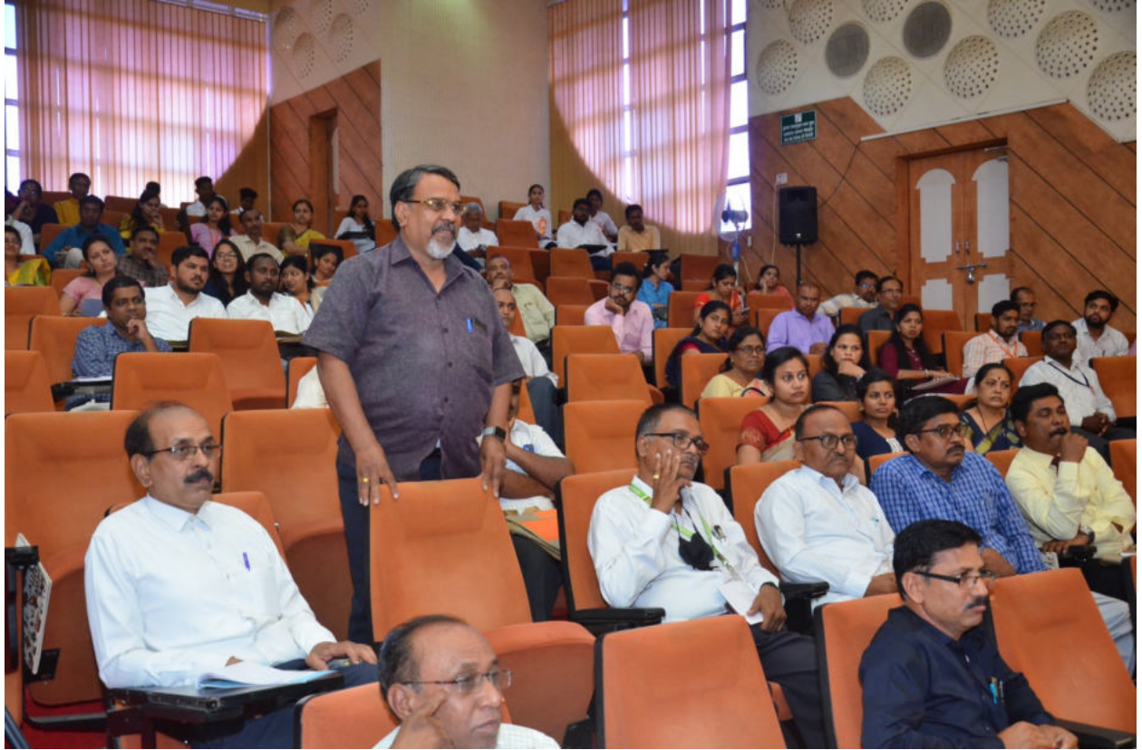
One of the delegates in Question-Answer session (April 9, 2022)